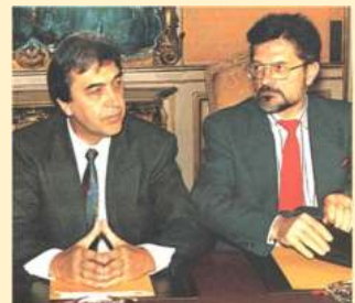
Fédération de l'Éducation Nationale UNE SCISSION PROGRAMMÉE